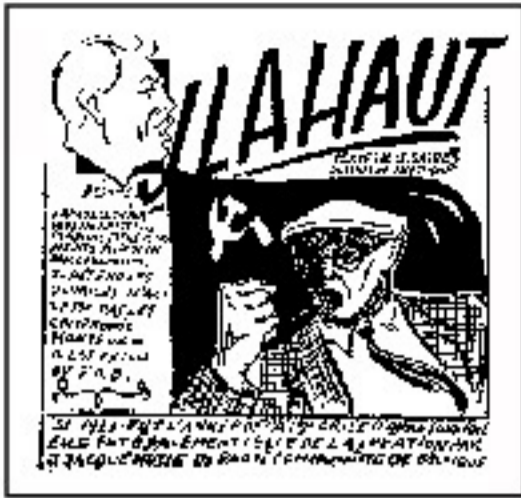
Extrait de la bande dessinée «J. Lahaut» de Ita Gassel et André Jacquemotte reproduite intégralement dans le livre