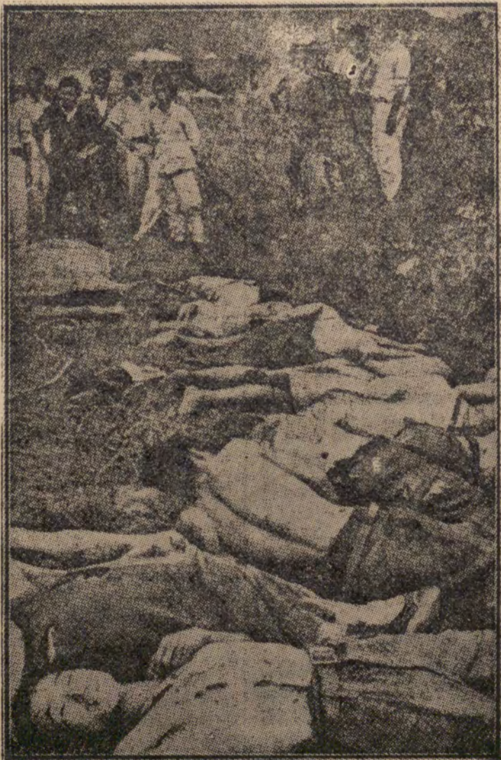
Ces patriotes-là ont été fusillés par la police des fantoches aux ordres des Américains.

C'est ce régime de misère et de sang dont Syngman Rhée a cru prolonger la durée par une provocation à l'échelle américaine.