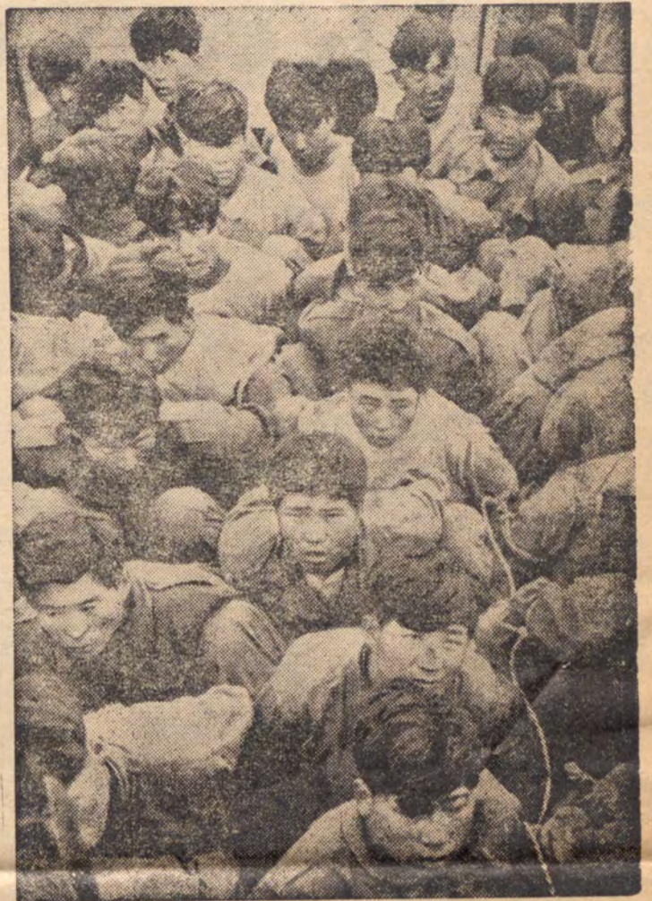
Ces patriotes coréens, liés par des cordes, sont jetés et entassés dans des camions. Ils sont conduits vers le tribunal américano-coréen, c'est-à-dire vers la mort.